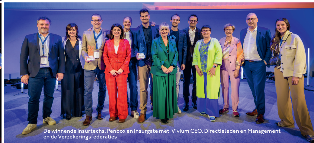
De winnende insurtechs, Penbox en Insurgate met Vivium CEO, Directieleden en Management en de Verzekeringsfederaties