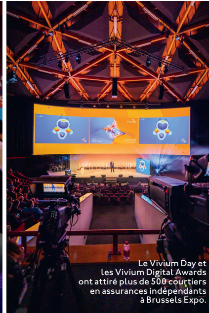
Le Vivium Day et les Vivium Digital Awards ont attiré plus de 500 courtiers en assurances indépendants à Brussels Expo.