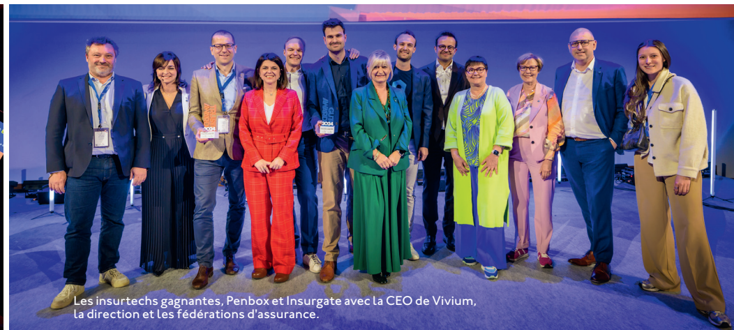
Les insurtechs gagnantes, Penbox et Insurgate avec la CEO de Vivium, la direction et les fédérations d'assurance.